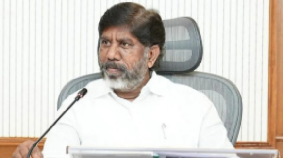
ఎలా ఉంటుందన్న ఆందోళన ప్రభుత్వ వర్గాల్లో వ్యక్తమవుతోందని సమాచారం. ఈ అంశంపై ప్రభుత్వం అధికారిక వివరణ ఇవ్వాలని అవసరం ఉందని విజ్ఞప్తులు సూచిస్తున్నాయి.

ఆరోపిస్తున్నాయి. రాజకీయ వర్గాల్లో వినిపిస్తున్న చర్చల ప్రకారం, ఖమ్మం జిల్లా తన ఆధిపత్యాన్ని చాటుకునే క్రమంలోనే ఈ నిర్మాణం చేపట్టారని, ముఖ్యంగా పొంగులేటి శ్రీనివాస్ రెడ్డి, తుమ్మల నాగేశ్వరరావులకు ఒక రాజకీయ సందేశం ఇవ్వడానికే ఈ భవనం నిర్మాణమని ప్రచారం సాగుతోంది. అయితే ఈ వ్యాఖ్యలపై అధికారికంగా ఎటువంటి స్పష్టికరణ వెలువడలేదు. ఇదే సమయంలో పెన్షనర్లకు పెండింగ్ బకాయిలు, రిటైర్డ్ ఉద్యోగుల బెనిఫిట్లు, ఫీజు రీయంబర్స్ మెంట్ వంటి అంశాలకు నిధుల కొరత ఉందని ప్రభుత్వం పేర్కొంటున్న నేపథ్యంలో, మంత్రిగారి కోసం భారీ వ్యయంతో భవనం నిర్మాణం చేపట్టడంపై ప్రజల్లో ఆసక్తి వ్యక్తమవుతోంది. అలాగే, ఒక మంత్రికి ఇంత భారీ స్థాయిలో క్యాంపు కార్యాలయం నిర్మిస్తే, ఇతర మంత్రులు కూడా ఇలాంటి సదుపాయాలు కోరితే పరిస్థితి