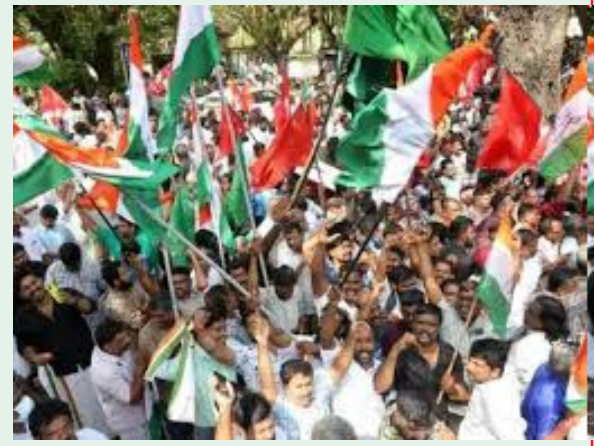
బెంగాల్, తమిళనాడులో ప్రాంతీయ పార్టీలైన టీఎంసీ, డీఎంకేలు గెలిస్తే, ఇండియా కూటమిలో కాంగ్రెస్ ప్రాధాన్యత తగ్గి, మమతా బెనర్జీ, స్టాలిన్ వంటి నేతలు జాతీయ నాయకత్వం వైపు మొగ్గు చూపే అవకాశం ఉంది. 2029 లోకసభ ఎన్నికలకు ముందు ఈ ఐదు రాష్ట్రాల ఫలితాలు దేశ రాజకీయ గమనాన్ని మార్చునున్నాయి.

ఎంపీగా ఉండటంతో గెలుపు సాధించడం ప్రతిష్టాత్మకంగా మారింది. అసోంలో ముఖ్యమంత్రి హిమంత్ బిశ్మ శర్మ తిరుగులేని నాయకుడిగా ఎదిగారు. అభివృద్ధి, హిందుత్వ నినాదాలతో బీజేపీ మూడోసారి అధికారంపై కన్నేసింది. కాంగ్రెస్ పార్టీ ఇక్కడ అంతర్గత కుమ్ములాటలతో ఇబ్బంది పడుతోంది. పైగా కీలక నేతలు బీజేపీలో చేరడం ఆ పార్టీకి పెద్ద దెబ్బ. ఏబియూడిఎఫ్ వంటి పార్టీలతో పొత్తులు కుదిరితేనే కాంగ్రెస్ ఇక్కడ గట్టి పోటీ ఇచ్చే అవకాశం ఉంది, లేదంటే బీజేపీకి మార్గం సుగమం అవుతుంది. పుదుచ్చేరిలో ఎన్. రంగస్వామి నేతృత్వంలోని ఏబిఎన్ఆర్సీ, బీజేపీ కూటమి అధికారాన్ని నిలబెట్టుకోవాలని చూస్తోంది. గతంలో ఇక్కడ కాంగ్రెస్ బలంగా ఉండేది, కానీ నేతల వలనలు ఆ పార్టీని బలహీనపరిచాయి. ఇక్కడ కూడా డీఎంకే మద్దతుతోనే కాంగ్రెస్ తన ఉనికిని చాటుకోవాల్సిన పరిస్థితి ఉంది. చిన్న రాష్ట్రం అయినప్పటికీ, ఇక్కడ గెలుపు కేంద్రంలోని అధికార పార్టీకి ప్రతిష్టాత్మకం. ఈ ఎన్నికలు కాంగ్రెస్ పార్టీకి అత్యంత కీలకం. కేరళలో అధికారం దక్కించుకోలేకపోతే, ఆ పార్టీ కేవలం కొన్ని చిన్న రాష్ట్రాలకే పరిమితమయ్యే ప్రమాదం ఉంది. మరోవైపు,