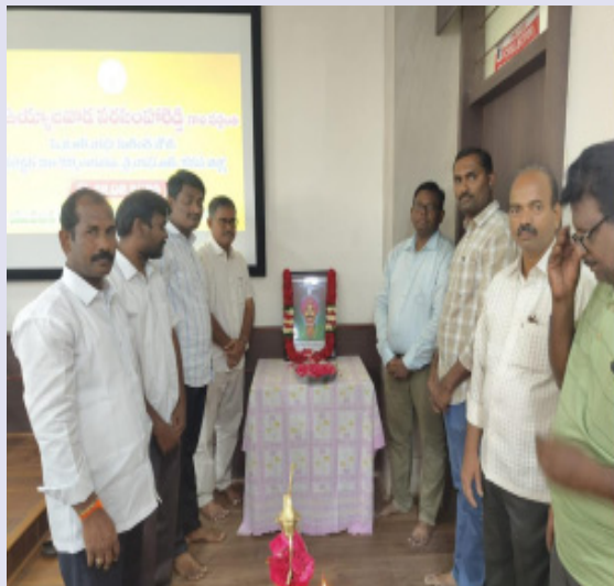
అంటే 1947 ఆగష్టు 15 వ తేదీన మన దేశానికి స్వాతంత్ర్యం లభించింది.

నేటి యువతరానికి ఆదర్శ మూర్తి, ప్రాతః స్మరణీయుడు అయిన ఉయ్యాలవాడ నరసింహారెడ్డి 24-11-1806లో ఆంధ్ర ప్రదేశ్ లోని కర్నూలు జిల్లా ఉయ్యాలవాడ మండలం, రూపనగుడి గ్రామంలో జన్మించారు. ఉయ్యాలవాడ నరసింహారెడ్డి 1847 ఫిబ్రవరి 22న బ్రిటిష్ పాలనకు వ్యతిరేకంగా పోరాడి, వీరమరణం పొందిన స్వాతంత్ర్య సమరయోధుడు. ఆయన కర్నూలు జిల్లాలోని ఉయ్యాలవాడ గ్రామానికి పాలెగాడు. నరసింహారెడ్డి తనకు రావలసిన భరణాన్ని ఇవ్వకపోవడంతో బ్రిటిష్ ప్రభుత్వంపై తిరుగుబాటు చేసి, అనేక పోరాటాలు చేశాడు. 1846 అక్టోబర్ 6న బ్రిటిష్ సైన్యం ఆయనను పట్టుకుని, 1847 ఫిబ్రవరి 22న ఉరి తీశారు. నరసింహారెడ్డి మరణానంతరం 100 సంవత్సరాలకు