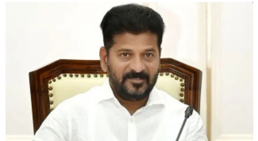
దృష్టి పెట్టాలని ముఖ్యమంత్రి రేవంత్ రెడ్డి సూచించారు.

విశాఖబాద్, ఫిబ్రవరి 21: రెండు తెలుగు రాష్ట్రాల డీసీసీ అధ్యక్షుల శిక్షణ కార్యక్రమాన్ని ముఖ్యమంత్రి రేవంత్ రెడ్డి ఈరోజు(శనివారం) ప్రారంభించారు. ఈ సందర్భంగా సీఎం మాట్లాడుతూ.. ఈ శిక్షణ డీసీసీ అధ్యక్షులకు ఎంతో ఉపయోగపడుతుందని తెలిపారు. వారి అవకాశాలను మెరుగుపరుచుకునేందుకు దీన్ని నద్వినయోగం చేసుకోవాలని సూచించారు. పార్టీ విధానాలు, ప్రజల సమస్యలపై చర్చించేందుకు ఈ తరగతులు సహాయపడతాయని సీఎం అన్నారు. రిజర్వేషన్లను రద్దు చేయాలనే కుట్ర జరుగుతోందని విమర్శించారు.